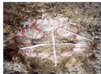
国道311号 和歌山県白浜バイパス