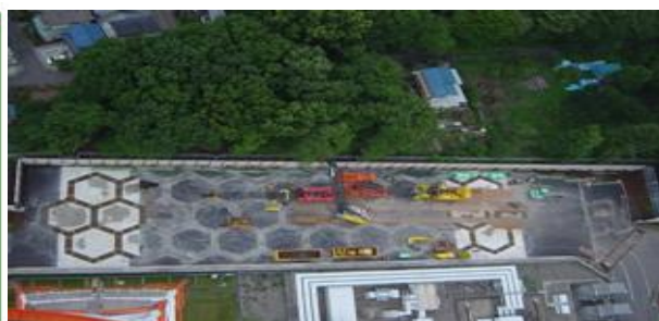
都内事業所の振動遮断WIB工事